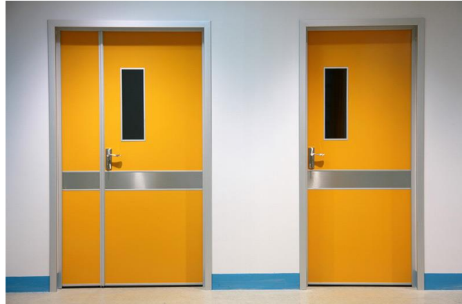
در های مقاوم در برابر حریق