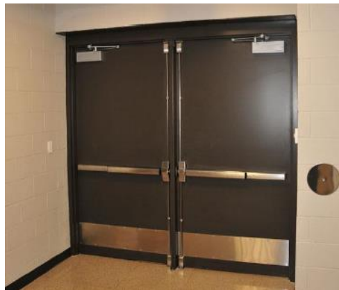
در های مقاوم در برابر حریق

تمامی درهای مقاوم حریق وارداتی که دارای تائیدیه از آزمایشگاه های معتبر به میزان ۹۰ دقیقه (۱/۵ ساعت) مقاوم در برابر حریق باشد.